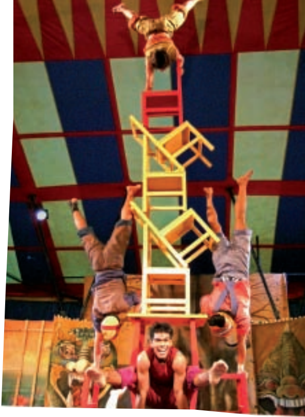
Feu dièze