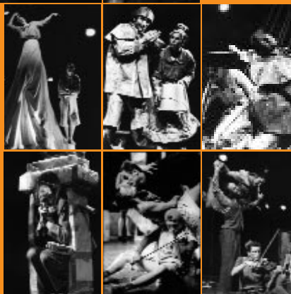
Je ne suis pas...