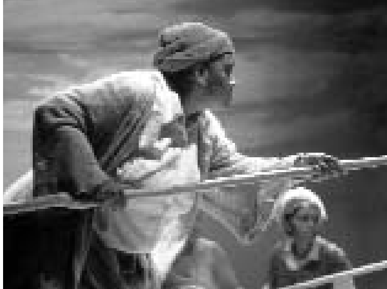
Mamans d'eau

Acte 3 en voyage dans les quartiers, les villes et les théâtres. Après des représentations de sa dernière création tout autour de l'île (St-Pierre, université, Les Avirons, Saint-André et Saint Philippe), la compagnie bénédictine est en résidence au théâtre du Grand marché (St-Denis) avec : Kabaré faham ; L'amer, la mère, la mer en décentralisation dans les quartiers de Ste-Clotilde, Bois de Nêfles et Camélias, les médiathèques de St-Denis et du Port, les lycées et collèges de St-Denis. Mamans d'eau les 30 avril, 2 et 3 mai à 20 heures au CDR. Et l'aventure artistique continue avec Marcovaldo d'Italo Calvino, spectacle convivial et poétique. Les comédiens ont découvert dans un terrain vague une malle et ont reconstitué l'histoire de son propriétaire : Marcovaldo. Manœuvre et chargé de famille, il rêve beaucoup, à la nature surtout, guère présente dans l'univers de béton où il lui faut vivre. Cela lui vaudra des aventures vivantes et